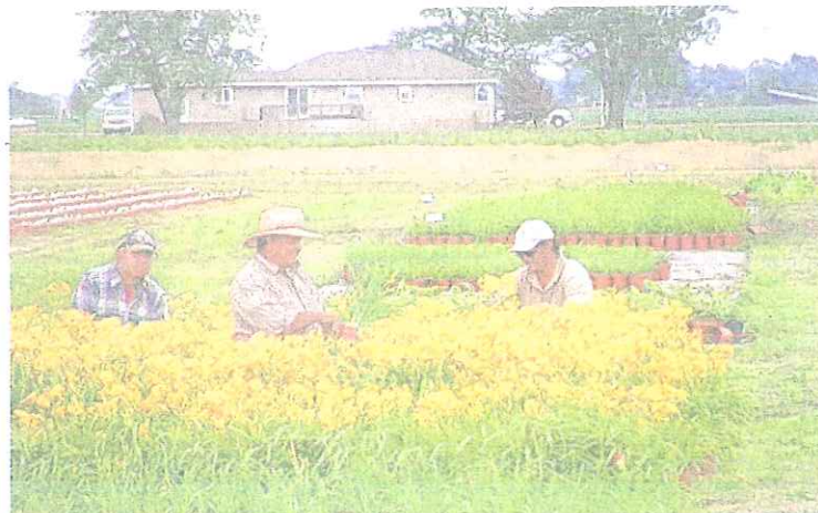
◆ Aún hay trabajo, a pesar de la mecanización en la agricultura.