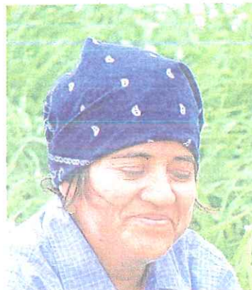
♦ Muchas mujeres se emplean en los viveros o "nurserías".

suelo y no tenía acceso a agua potable. Trabajaba entre 70 y 80 horas a la semana limpiando el rancho, alimentando a los animales y realizando otras tareas de peón. Le pagaban $200 por semana y fue despedido sin motivo hace dos semanas. Actualmente el proyecto brinda asistencia legal a este trabajador con su caso.