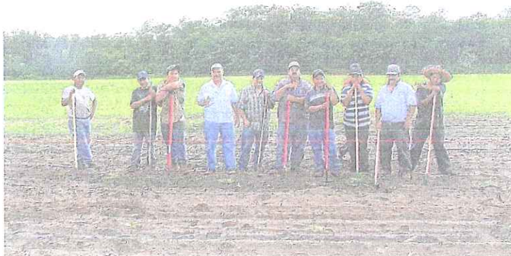
◆ Grupo de trabajadores agrícolas migrantes en Illinois.

Para información sobre clínicas y ferias de salud en zonas rurales de Illinois, lea el artículo completo en www.laraza.com